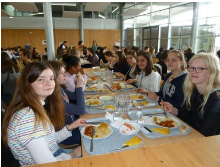
Schulleben: Gemeinsames Mittagessen in der Kantine