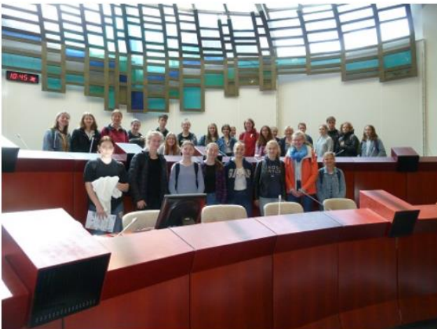
Ausflug zum Landtag und Vortrag über die Entscheidungsgremien im Landtag: Unsere Schüler/innen üben schon einmal politische Verantwortung