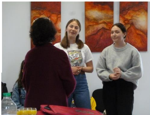
Empfang beim Bürgermeister: 2 Schülerinnen der EF begrüßen im Namen der Gruppe seine Stellvertreterin